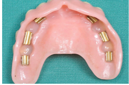
Figuur 5: klikgebit met hulzen die op de staafjes van de implantaten worden vastgeklikt

Voor het vastzetten van het klikgebit in de bovenkaak, worden meestal vier tot zes implantaten geplaatst. Dit is nodig omdat de botkwaliteit in de bovenkaak minder goed is dan in de onderkaak. Met meer implantaten worden de kauwkrachten beter over de bovenkaak verdeeld. Op de implantaten komen drukknoppen of tussen de implantaten wordt een verbindingstuk gemaakt waarop het gebit kan worden vastgeklikt (figuur 4). Omdat het klikgebit stevig vastzit op de implantaten, is geen kunststof gehemelteplaat meer nodig. Het gevoel voor smaak en temperatuur nemen hierdoor toe.