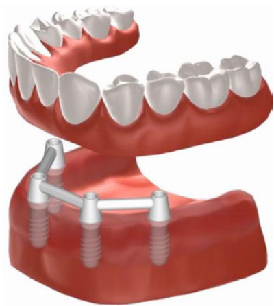
Figuur 3: klikgebit voor de onderkaak op vier implantaten met verbindingsstaafjes