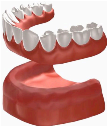
Figuur 1: traditionele prothese

Een gewone gebitsprothese zuigt zich normaal gesproken vast op het mondslijmvlies (figuur 1). Maar als het kaakbot slinkt, krijgt de prothese minder houvast waardoor deze minder goed blijft zitten. Een slechtzittende prothese is voor veel mensen niet alleen een esthetisch probleem, maar kan ook pijnlijke plekken veroorzaken op het tandvlees. Een klikgebit op implantaten kan een oplossing zijn voor deze klachten.