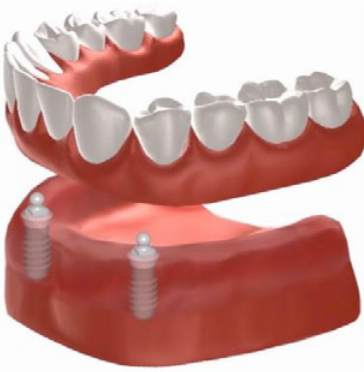
Figuur 2: klikgebit voor de onderkaak op twee implantaten